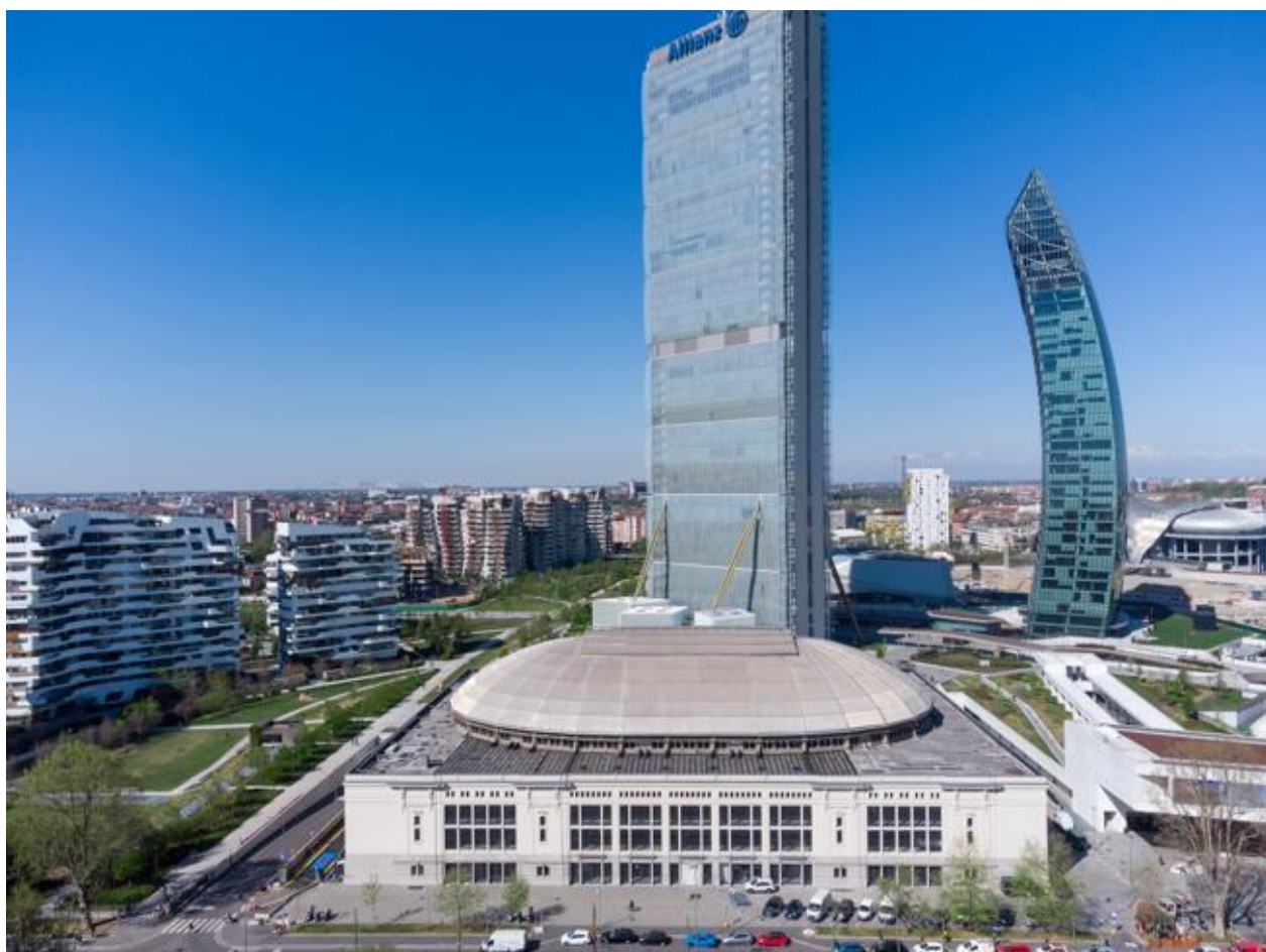
Palazzo Scintille, Piazza 6 Febbraio, MILANO